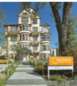
Eingang Business School